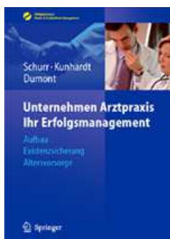
Das duxsess Erfolgsmanagement