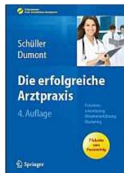
Die erfolgreiche Arztpraxis, 4. Edition